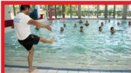
AQUA FITNESS MARDI 18H - 1 ACT