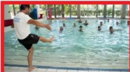
AQUA FITNESS VENDREDI 17H05 - 1 ACT