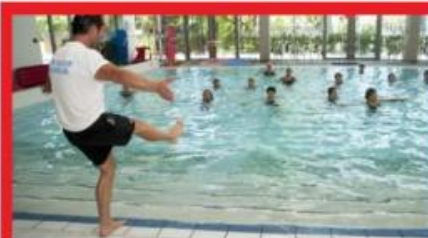
AQUA FITNESS VENDREDI 18H55 - 1 ACT