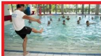
AQUA FITNESS JEUDI 12H15 - 1 ACT