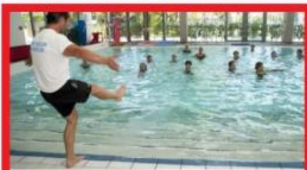
AQUA FITNESS MARDI 12H15 - 1 ACT