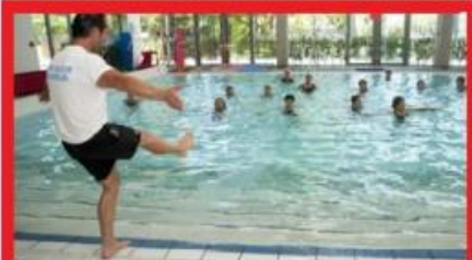
AQUA FITNESS VENDREDI 13H15 - 1 ACT